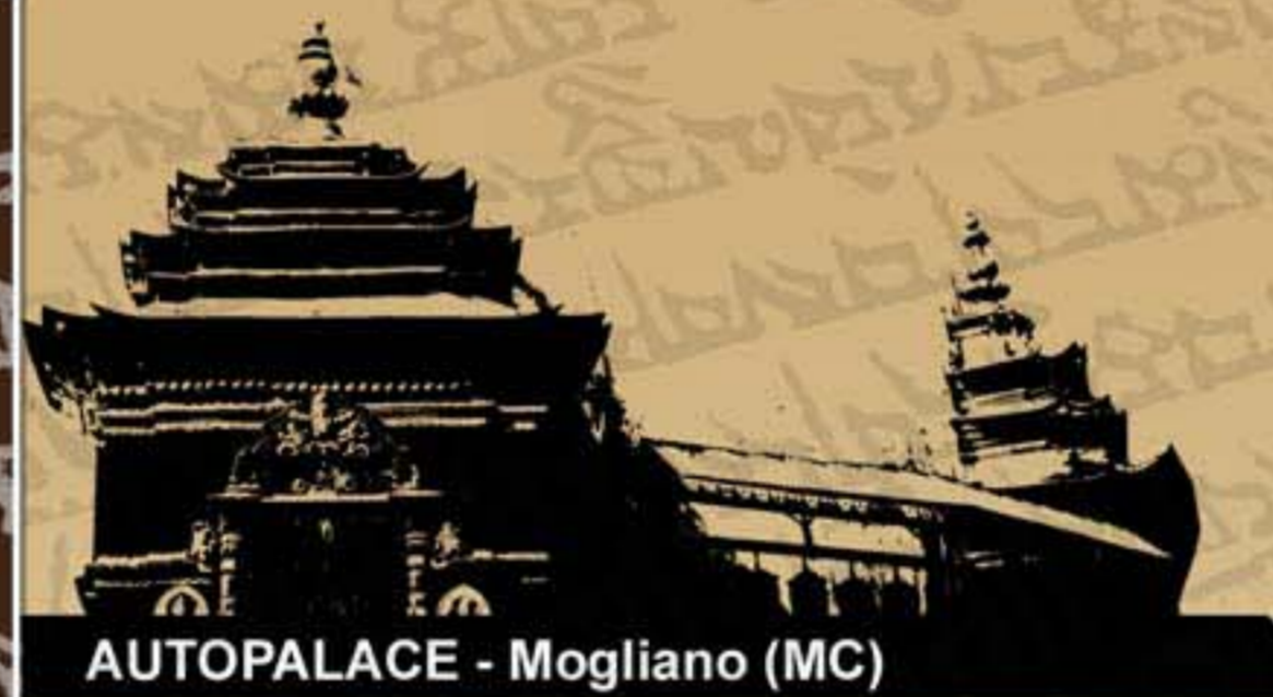
AUTOPALACE - Mogliano (MC)